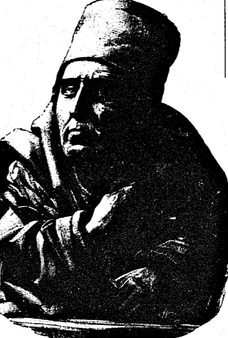
Jörg Eschlin der Ulmer, Stellschloße im Turmgehäuse des Ulmer Münsters.

In der That schritt der Bau lüthig voran, am Morgen begann er und man durfte bald an den stichtlichen Gebrauch denken, wenn auch mit Vorbehalt.