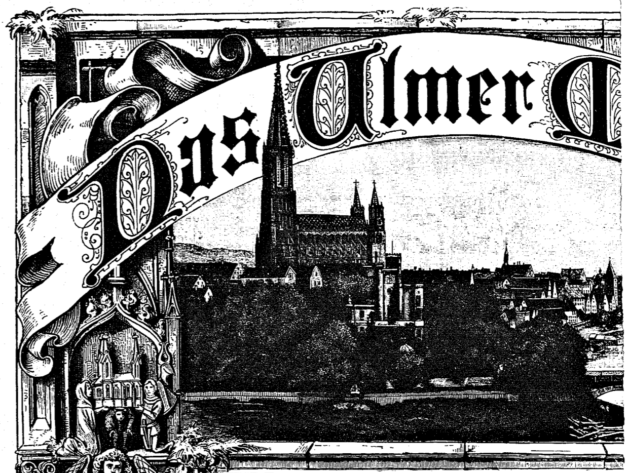
Ein Erinnerungsblatt zu seiner Vollendung