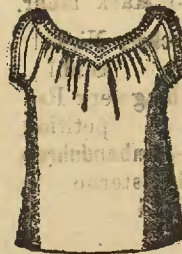
Damen-, Herren- u. Kinder-Wäsche.