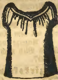
Damen-, Herren- u. Kinder-Wäsche.