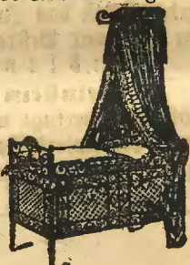
Bettstellen für Erwachsene u. Kinder.

Betten, Wäsche, Ausstattungen Matratzen, Patent-Beltrübe, Bettfedern, Flaum, Steppdecken, Woll- u. Bügeldecken Tischzeug, Hausstands- u. Badewäsche Vorhänge, Leinen- und Baumwollwaren, Schürzen, Flanelle, Tricotagen Kragen und Manschetten.